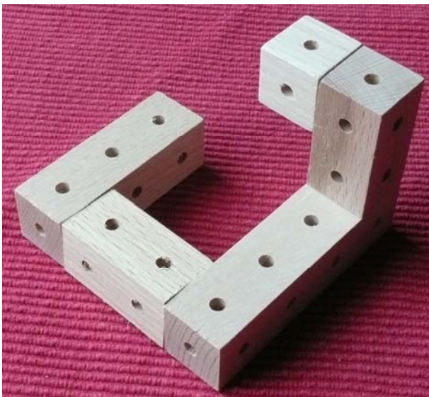
Abb.3 Bauwerk 3

2. Zeichne nun mit Bleistift wie in der Abbildung 4 in dein Arbeitsheft jeweils 3 zusammenhängende Ansichten der Bauwerke 1 und 2